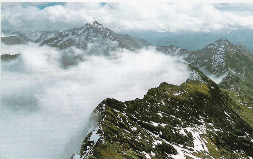
La cresta del Malh de Bolard vista des del mateix cim (al fons destaca el Tuc de Barlonguèra), amb el vessant del Couserans cobert de boira.