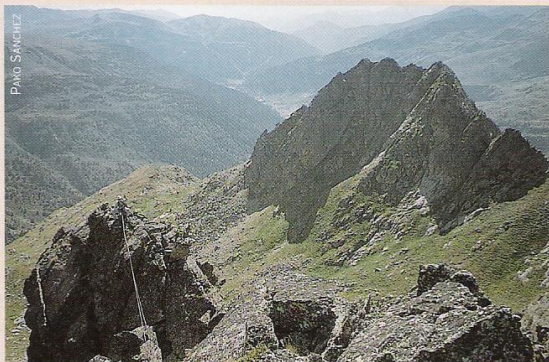
L'escalada de l'esperó es veu coronada per la cresta fins al cim de l'Alt de Juclar. Al fons, la vall d'Incles.

Si us agraden els itineraris desconeguts, el granit d'alta muntanya, els marcs paisatgístics oberts, les excursions d'aproximació, els itineraris molt poc equipats, les crestes aèries, els esperons i el sol, llavors continueu en la lectura d'aquestes paraules. Si us agraden els itineraris coneguts, no us complau el granit de l'alta muntanya i tan sols us van les aproximacions-passeig i les vies plenes de la brillantor de les "xapes" de parabolts; si teniu respecte a les crestes aèries, als esperons retallats, llavors... no aneu a l'esperó S de l'Alt de Juclar.