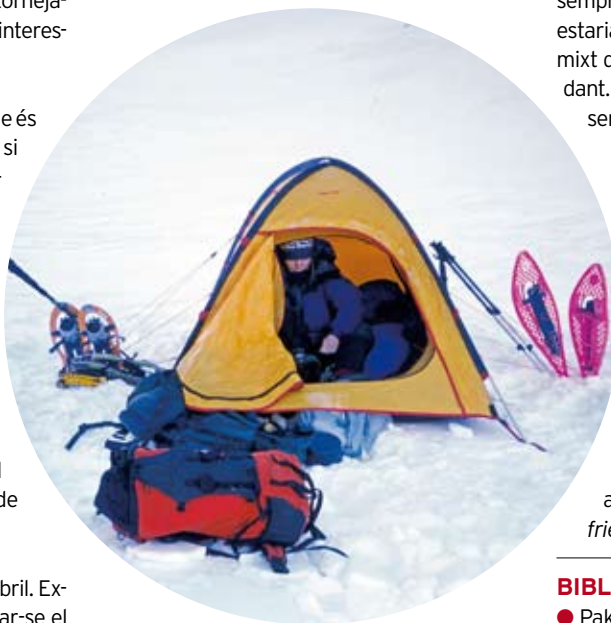
● Les aproximacions es poden fer sortint directament del cotxe o instal·lant "luxosos" campaments intermedis com aquest de sota el coll de la Marrana.

Possiblement aquest itinerari, escalat el març de 1997 i no divulgat fins al moment, sigui el primer itinerari obert en aquest vessant tan peculiar i inhòspit. Enllaça unes canaletes de neu sobre una mena d'esperó emmarcat per dues canals més fàcils. La via va ser recorreguda en sentit descendent i tornada a realitzar en sentit ascendent. Poden ser-hi útils tascons o friends . ▼