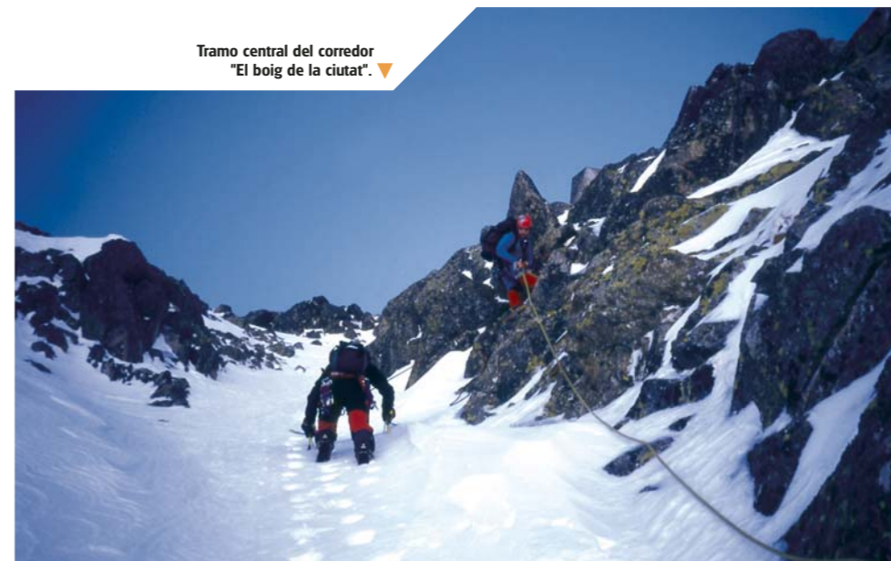
Tramo central del corredor "El boig de la ciutat". ▼

radas como las imprescindibles de la zona. Ambas están situadas en el cuadrante inferior derecho de la pared, y a su lado se han concentrado gran cantidad de líneas, explotando la zona mixta más atractiva de la pared. Otras vías a resaltar en este cuadrante sería el Boig de la ciutat , con una corta, pero sugerente, cascada al principio, y el Espolón de la Montse : un itinerario caído en el olvido, obra de un gran maestro de las grandes ascensiones: Jordi Tosas.